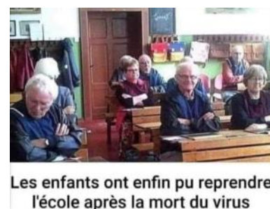
Les enfants ont enfin pu reprendre l'école après la mort du virus