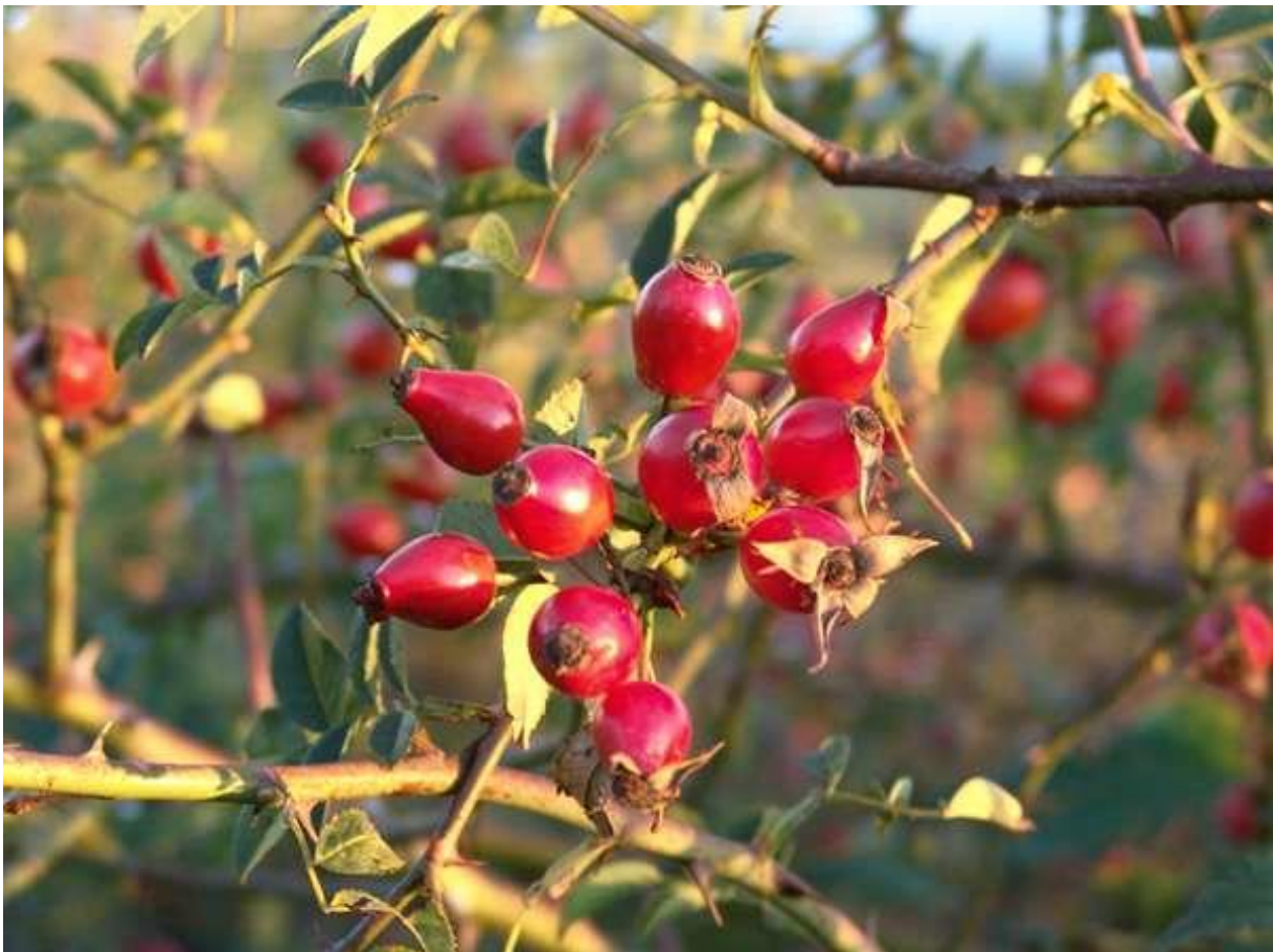
Fruits de l'églantier : cynorrhodon

Faux-fruit : d'un point de vue botanique, le fruit est issu du développement du carpelle fécondé. Parfois, le fruit est à la fois issu du développement du carpelle mais également des induvies (tous les organes de la fleur qui se développent après fécondation et donc, qui accompagnent le fruit au lieu de disparaître), on parle alors de faux-fruit.