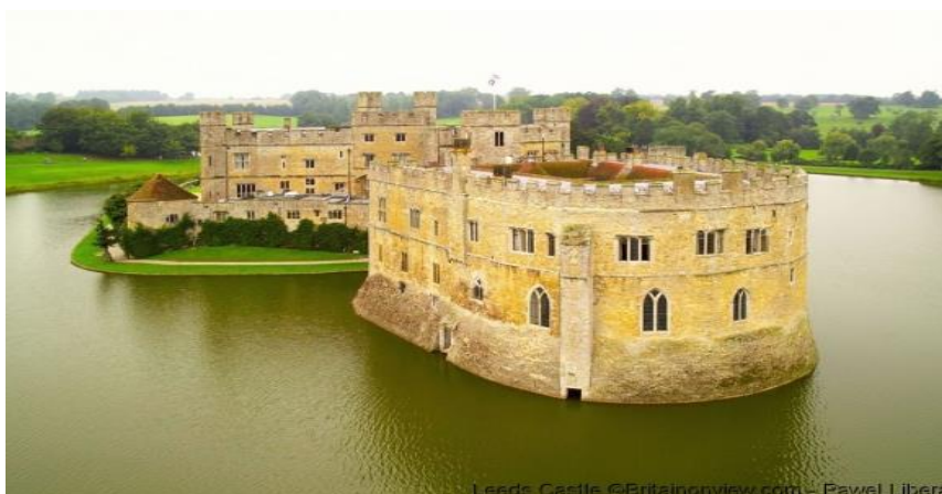
Le château de Leeds

Continuation vers le tunnel sous la Manche, Calais pour arriver en Ile-de-France en début de soirée.