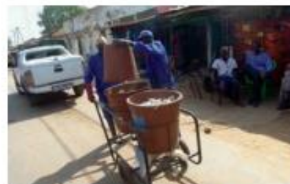
↑ Ramassage des poubelles dans la ville de Koungheul

7 villages sont raccordés aux réseaux existants, ce qui permet d'approvisionner 8 000 personnes