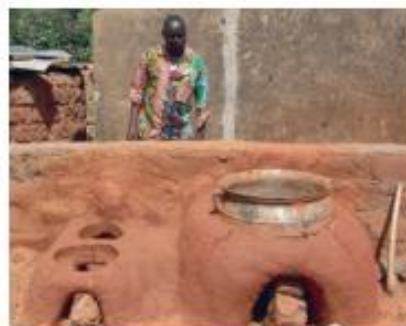
† Foyer amélioré