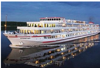
Bateau de croisière : M/S KRONSTADT « 4 ANCRES »