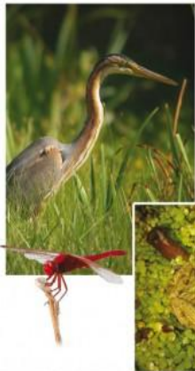
De gauche à droite: Héron pourpré, Libellule écarlate, Grenouille verte, Echasse blanche, Glaréole à collier, Héron garde-boeufs. Maquettage: Cyril Grand http://www.cyrilgrand.fr/