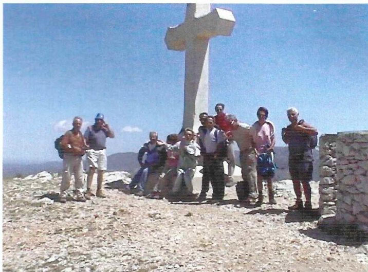
Le sommet du Garlaban et oui....

L'apéritif festif, qui a réuni 68 participants, a démontré, s'il le fallait, l'intérêt convivial de ce genre de manifestation.