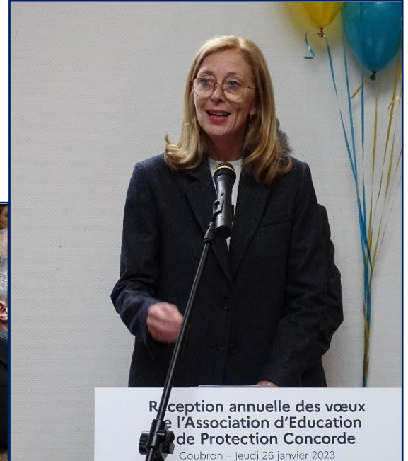
Reception annuelle des vœux de l'Association d'Education de Protection Concorde Coubron – Jeudi 26 janvier 2023 Madame Caubel, Secrétaire d'Etat en charge de l'Enfance, lors de son intervention

Cette cérémonie s'est achevée autour d'un magnifique et copieux buffet élaboré par l'ensemble des cuisiniers des maisons, aidés par Philippe et Sophie qui nous régalaient au restaurant pédagogique, avec le concours des jeunes, de l'équipe de la maison Marie Foilaine Desolneux, où tous les participants s'étaient réunis pour l'occasion.