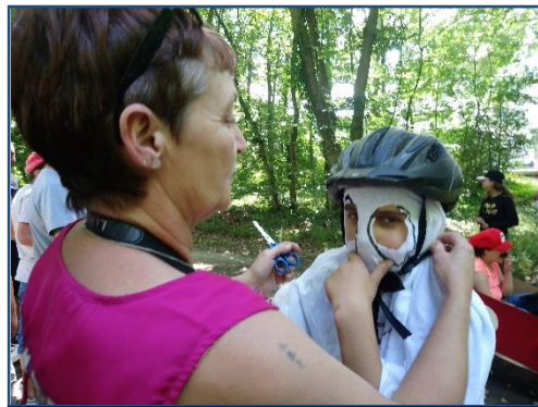
2017, avant la course de pushcar