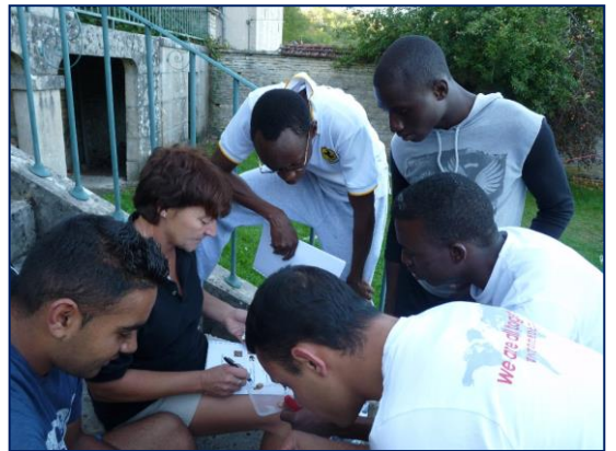
2011 à Vertault : préparation d'un jeu de piste

Tous ont profité de son talent pour les arts graphiques ; fresques dans nos deux maisons de Gagny, magnifiques affiches réalisées pour les 40 ans puis les 50 ans de l'AEPC... Les milliers de photos qu'elle a prises depuis plus de 18 ans sont devenues de précieux témoignages de la richesse et de la diversité d'actions conduites par Concorde.