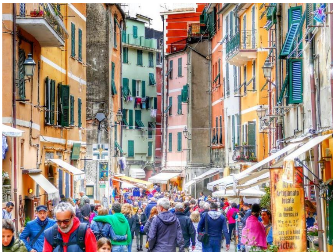
Les ruelles commerçantes animées et colorées, au cœur des Cinque Terre

Nous vous remercions de nous adresser la copie (bien lisible) de votre carte d'identité ou de votre passeport que vous utiliserez lors de votre voyage (de préférence par mail ou par courrier).