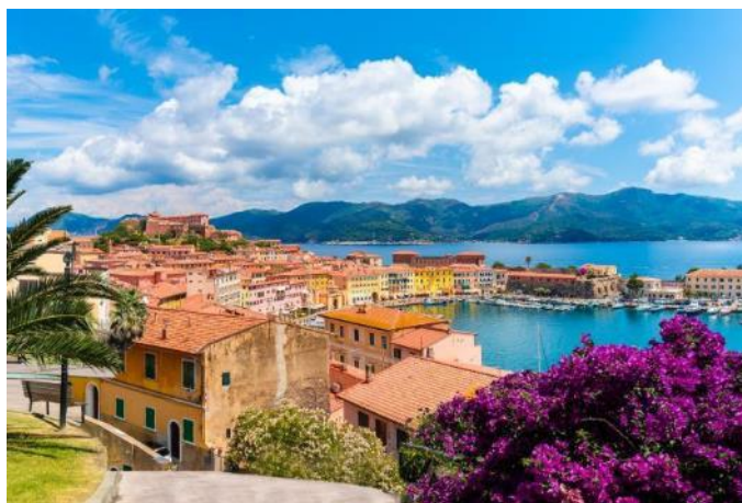
Le port de Portoferraio, porte d'entrée de l'île d'Elbe

L'occasion également de découvrir les Cinque Terre, parc national pittoresque classé au patrimoine mondial de l'UNESCO. Cette côte escarpée et sauvage, parsemée de petits villages, vous surprendra par sa beauté éclatante de couleurs.