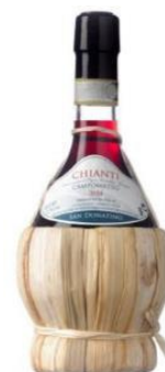
Le Chianti, célèbre vin de Toscane