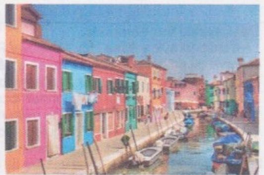
La petite île de Burano et ses maisons

Retour à l'hôtel en fin d'après-midi. Dîner au restaurant et nuit à l'hôtel.